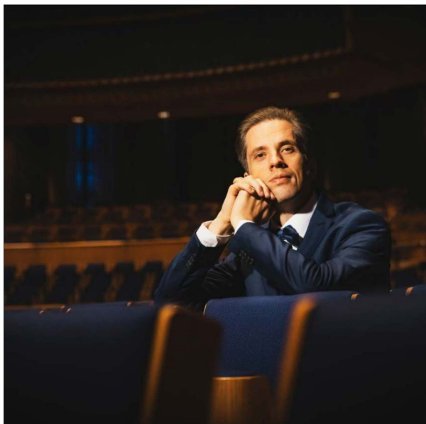
Severin Von Eckardstein est considéré comme le plus grand artiste allemand de sa génération.

Le belge Florian Noack enchaîne le 29 juillet avec un répertoire romantique. Ses programmes incluent souvent des compositeurs tels que Lyapunov, Alkan et Medtner. Le public bastiais sera comblé avec la transcription propre du pianiste de Shéhérazade de Rimsky Korsakov. Le 31 juillet, le festival se déplace sous le ciel étoilé d'Erbalunga. Severin Von Eckardstein, va exécuter, avec un véritable art de rubato, des partitions de Clementi, Brahms, Medtner ou en-